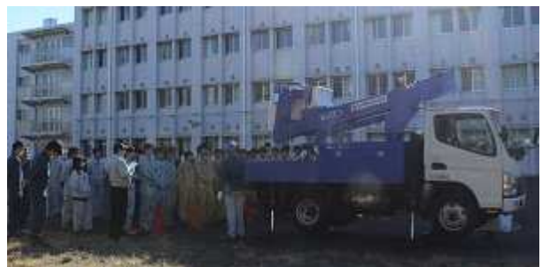
高所作業車特別教育の講習会の様子(実技) 11月25日(土)・26日(日)